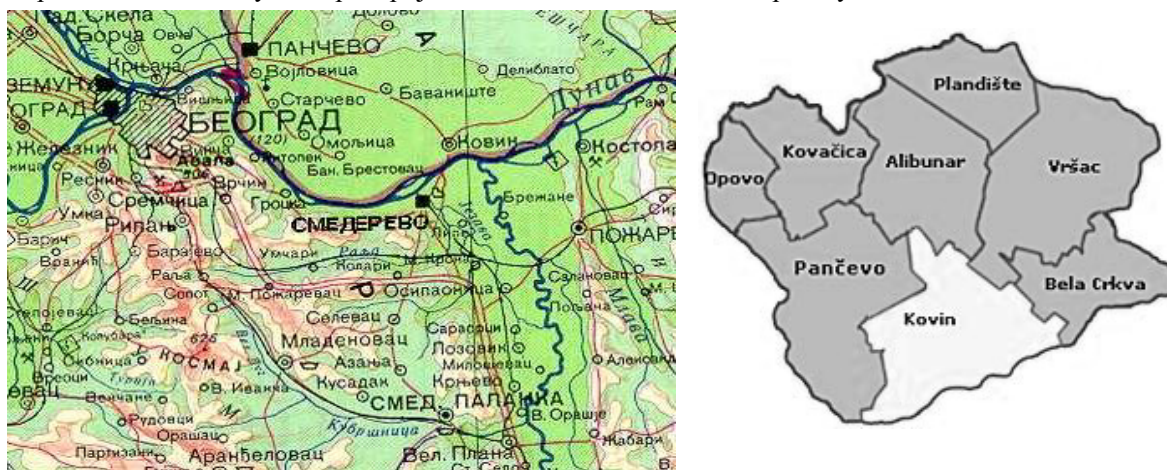
Слика 1: Положај општине Ковин у односу на општине у Војводини и градове Смедерево и Пожаревац

Територија општине Ковин захвата најјужнији део Баната. У административно-регионалној подели територије Србије и Војводине, општина Ковин припада Јужно-банатском округу. На западу, северу и истоку простор општине се граничи са општинама Алибунар, Вршац, Бела Црква и градом Панчевом. На јужној страни према градовима Смедерево и Пожаревац границу општине чини ток реке Дунав. Општини Ковин припада 46 км обале Дунава, највећег Европског пловног пута. Територија општина Ковин захвата површину од 730 км 2 .